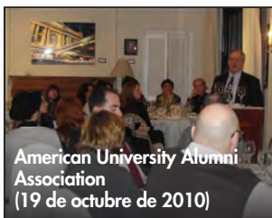
American University Alumni Association (19 de octubre de 2010)