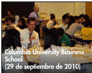
Columbia University Business School (29 de septiembre de 2010)

Entre los invitados de este año se encontraron Thomas Keller de French Laundry , el Iron Chef Morimoto, Ruth Reichl, ex directora de redacción de la revista Gourmet , David Chang de Momofuku , y muchos de los chefs de dos y tres estrellas del Japón.