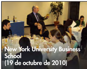
New York University Business School (19 de octubre de 2010)